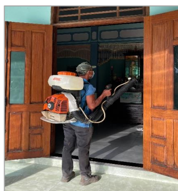
Hoạt động thu vét bọ gậy và phun hóa chất diệt muỗi

Tăng cường tuyên truyền các biện pháp phòng chống một số bệnh truyền nhiễm nổi bật như sốt xuất huyết, bạch hầu, ho gà... cho người dân trên địa bàn.