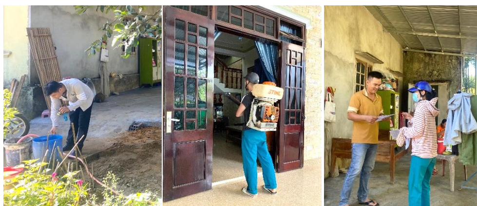
Hoạt động thu vét bọ gậy, phun hóa chất diệt muỗi, truyền thông phòng chống dịch sốt xuất huyết

Các xã/phường duy trì hoạt động diệt lăng quăng bọ gậy, vệ sinh cảnh quang môi trường phòng chống dịch sốt xuất huyết lồng ghép vào ngày Chủ nhật xanh.