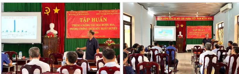
Hình ảnh: Tập huấn phòng, chống dịch sốt xuất huyết

Trung tâm Y tế thị xã Hương Trà đã tổ chức tập huấn kỹ năng giám sát véc tơ sốt xuất huyết cho cán bộ y tế tuyến thị xã và Trạm Y tế các xã/phường trên địa bàn thị xã.