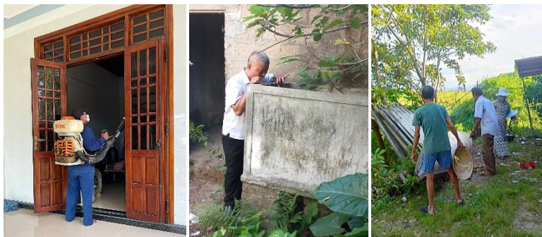
Hình ảnh: Phun hóa chất diệt muỗi, thu vét bọ gậy và truyền thông phòng chống dịch sốt xuất huyết

Phun hóa chất diệt muỗi xử lý các ca bệnh sốt xuất huyết tại 02 xã Bình Thành và Hương Toàn, số hộ được phun là 80 hộ, tiến hành thu vét bọ gậy trong khu vực phun, chỉ số bọ gậy trước phun xử lý dao động từ 13 - 20; chủ yếu ở các vật dụng chứa nước như xô, bể cảnh, vật phế thải. Tuyên truyền các biện pháp phòng chống sốt xuất huyết cho người dân trong khu vực.