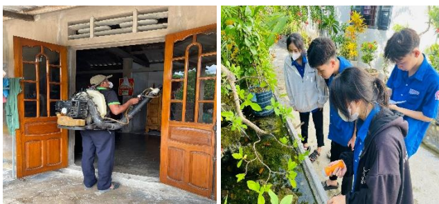
Hình ảnh: Xử lý ca bệnh sốt xuất huyết

Phun khử khuẩn môi trường ca bệnh tay chân miệng bằng hóa chất cloramin B (03 hộ gia đình), hướng dẫn cách ly và các biện pháp phòng bệnh cho bệnh nhân và người dân xung quanh.