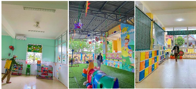
Hình ảnh: Phun khử khuẩn môi trường trước năm học mới

Triển khai phun khử khuẩn môi trường bằng hóa chất cloramin B tại các trường mầm non trước khi bước vào năm học mới.